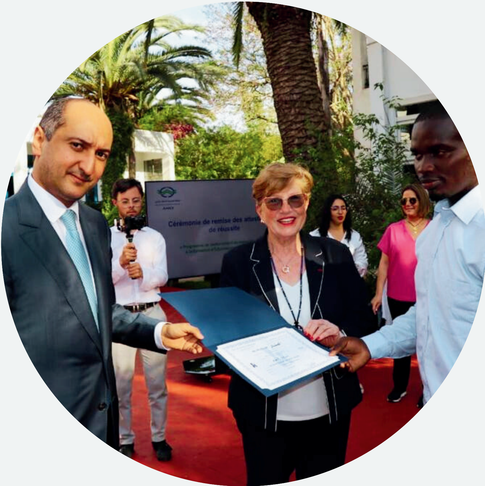
Dynamique Africaine - 1 ÈRE EDITION Formation de 8 éducatrices du Gabon, Côte d'Ivoire et Sénégal en partenariat avec l'AMCI